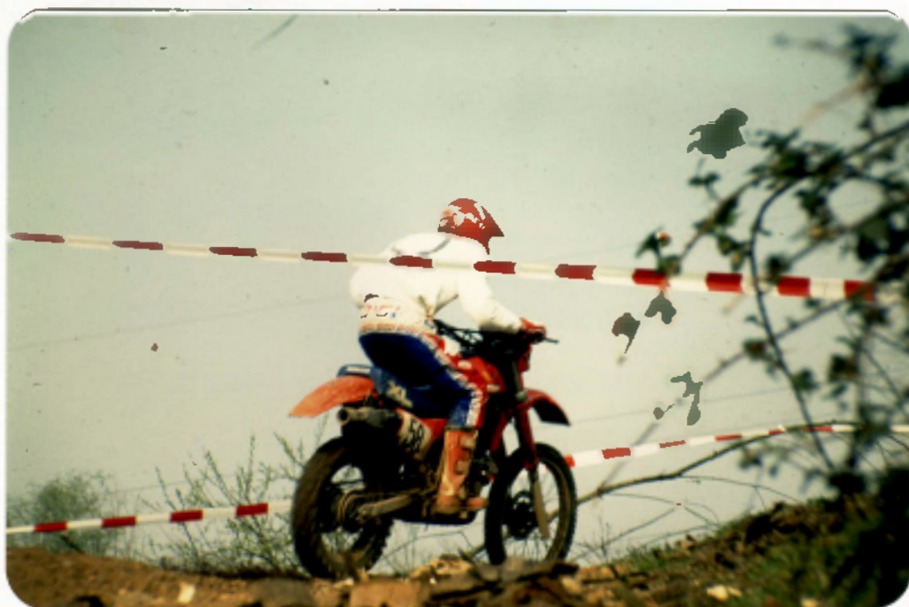
Stricki außer Wertung (technischer Defekt)