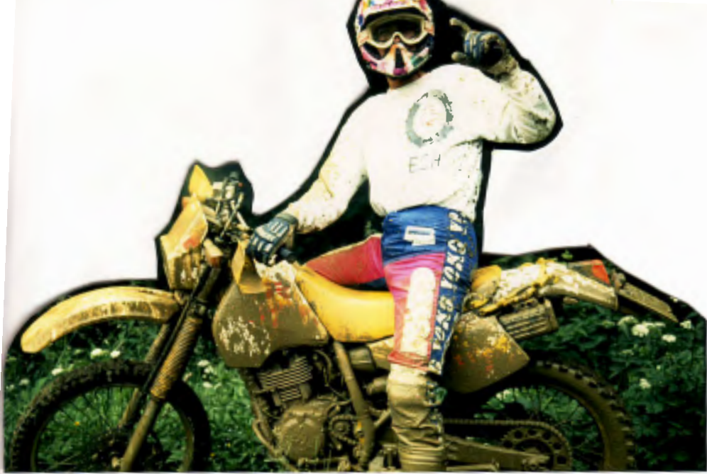
„Ömmer lekker wenke“