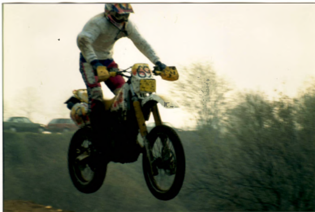
Mähnchen 8. Platz