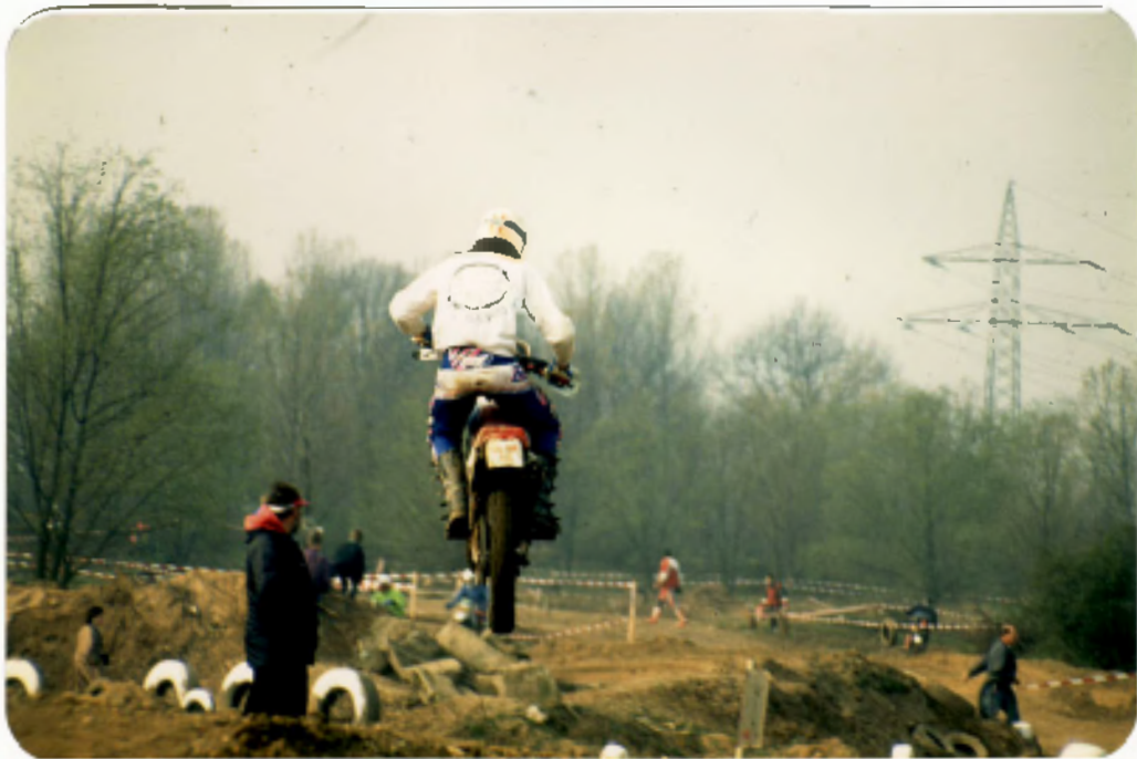
Brett 15. Platz