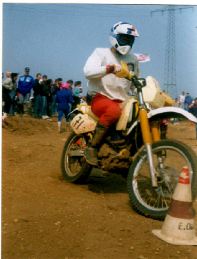
Opa 12. Platz