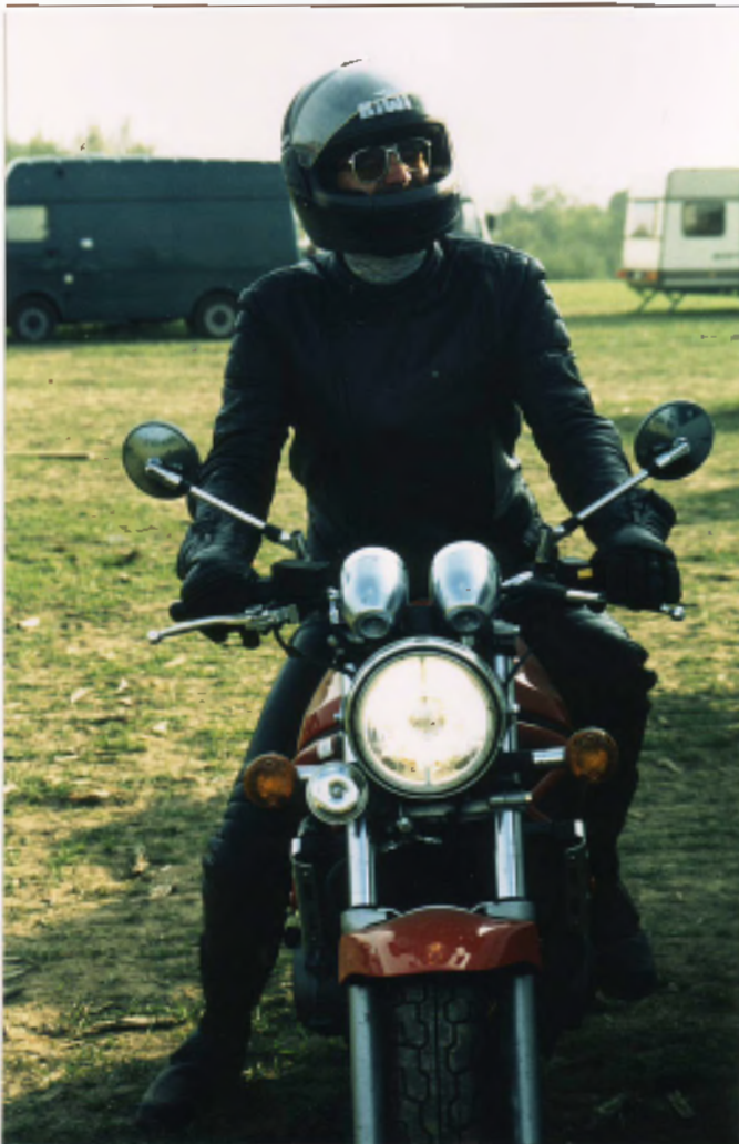
Erst MZ dann Suzi und demnächst BMW?