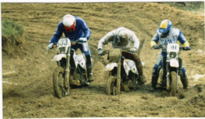
Mülli 3. Platz