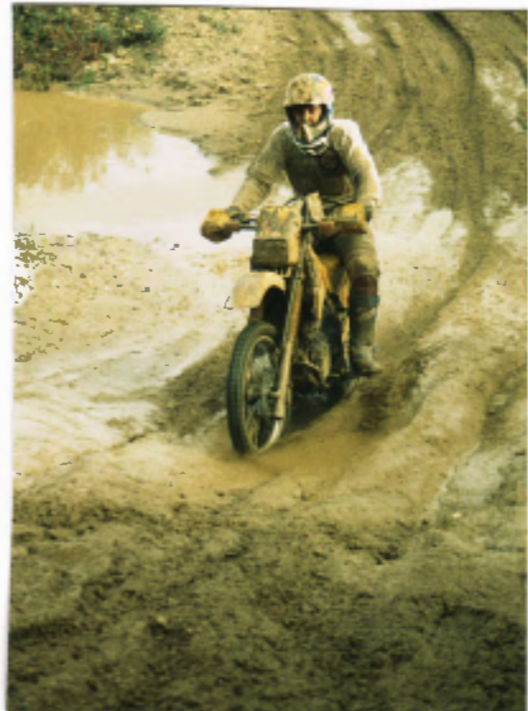
Hähnchen 6. Platz