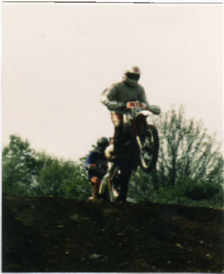
Möki 31. Platz