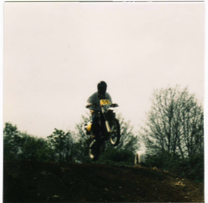
Luyvi 30. Platz