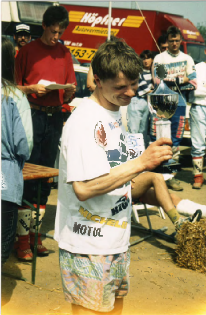
Pit 4. Platz