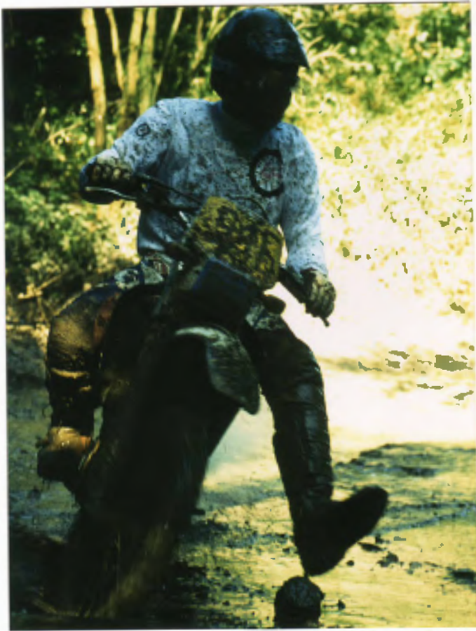
Luyvi 24. Platz