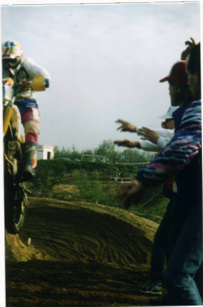
Hähnchen trotz La Ola - Welle leider mit technischem Defekt ausgefallen.