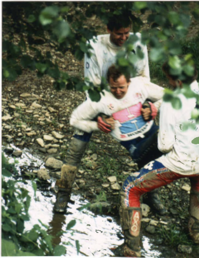
Unser Dank an einen der diesjährigen Bilstain-Organisatoren