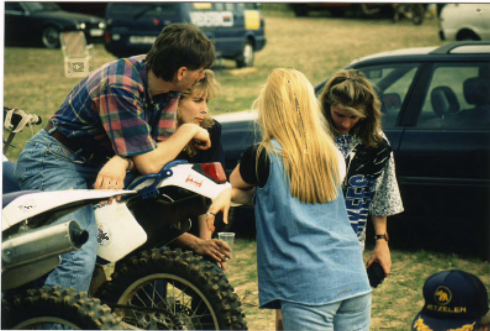
Seit ich DR 350 fahre, komme ich bei Frauen besser an.