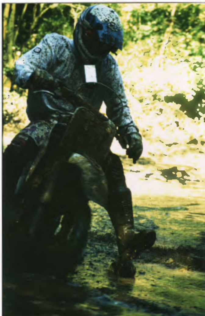
Ulf 15. Platz