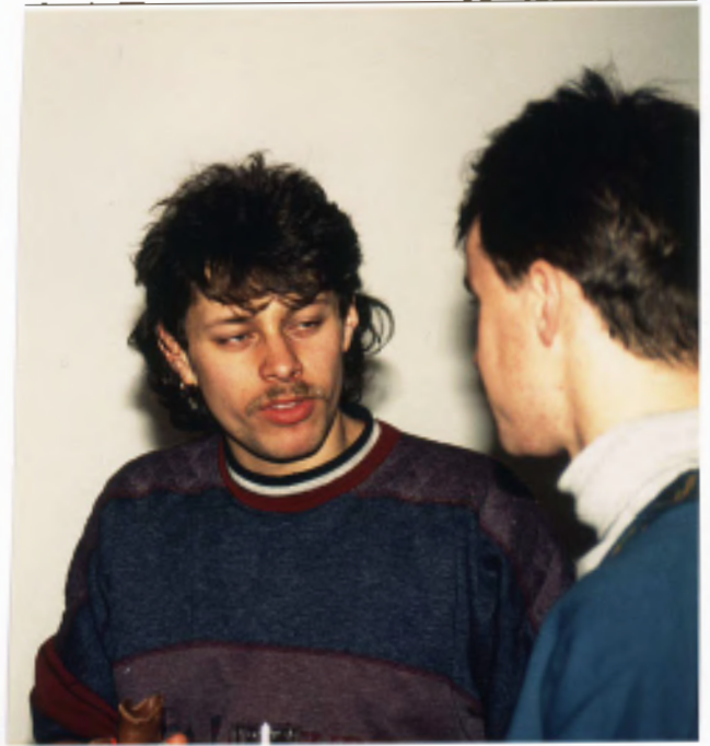
Alkis unter sich