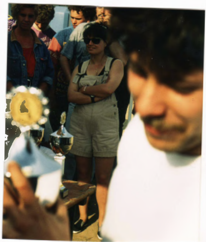
Mulli 2. Platz