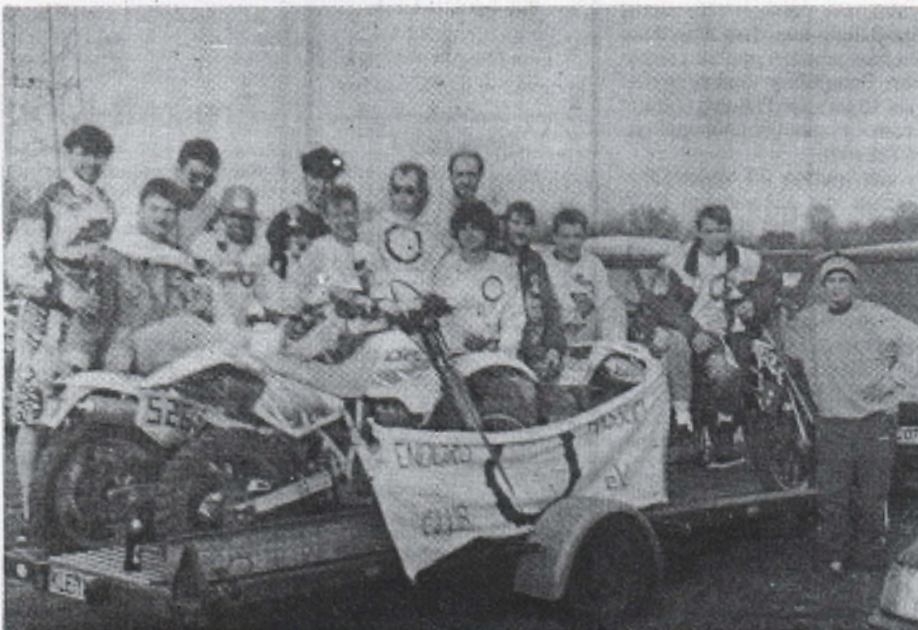
Auf Erfolgskurs: Das Hassumer Enduro-Team sammelte bei diversen Veranstaltungen wieder vordere Plätze.

Die nächste Aktivität des ECH ist der am Fronleichnamswochenende stattfindende Ausflug nach Belgien, wo neben dem Endurosport die Geselligkeit nicht zu kurz kommen soll.