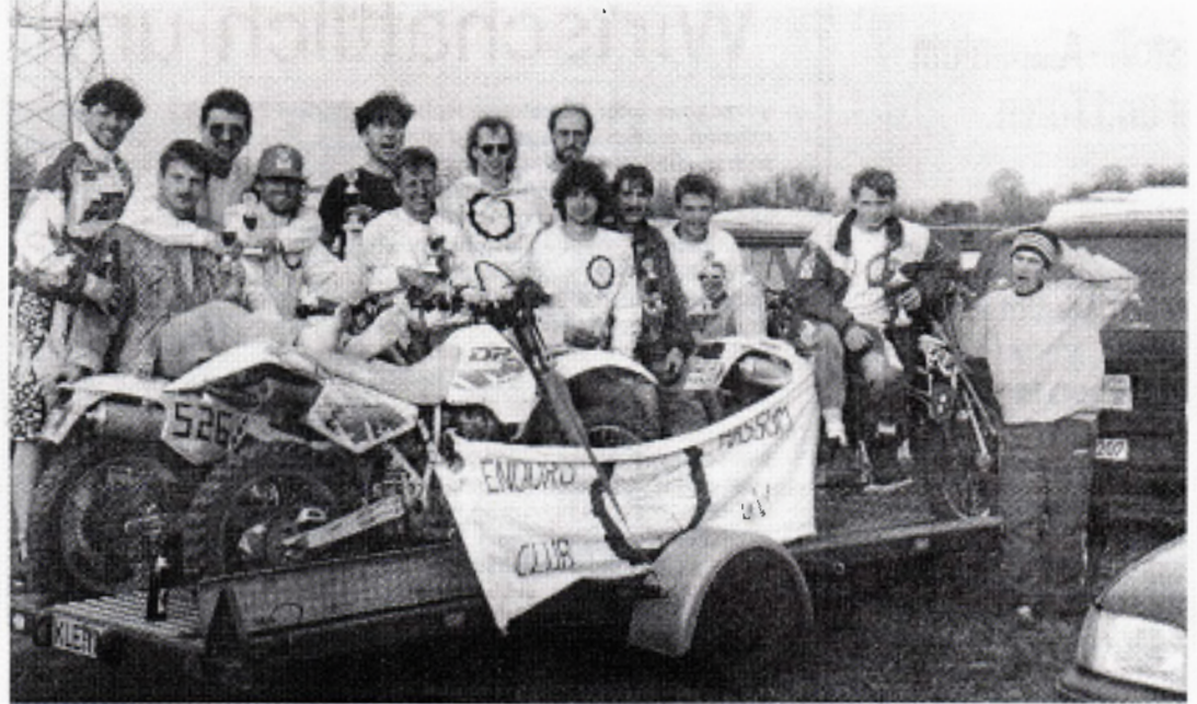
Die nächste Aktivität des ECH ist der am Fronleichnamswochenende stattfindende Ausflug nach Belgien, wo neben dem Endurosport die Geselligkeit nicht zu kurz kommt.

Enduro Club Hassum war in Mönchengladbach :