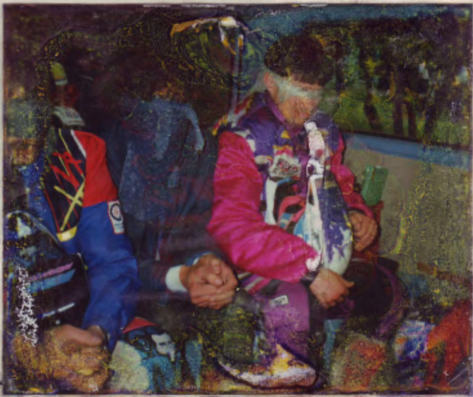
Hier eine Nachricht aus der ECH-Kindergarten-Abteilung: Nachdem Klein-Peterchen und Andere gespielt haben, wie Onkel Mulli seine Züge geschmiert hat, machten sie es ihm artig nach!