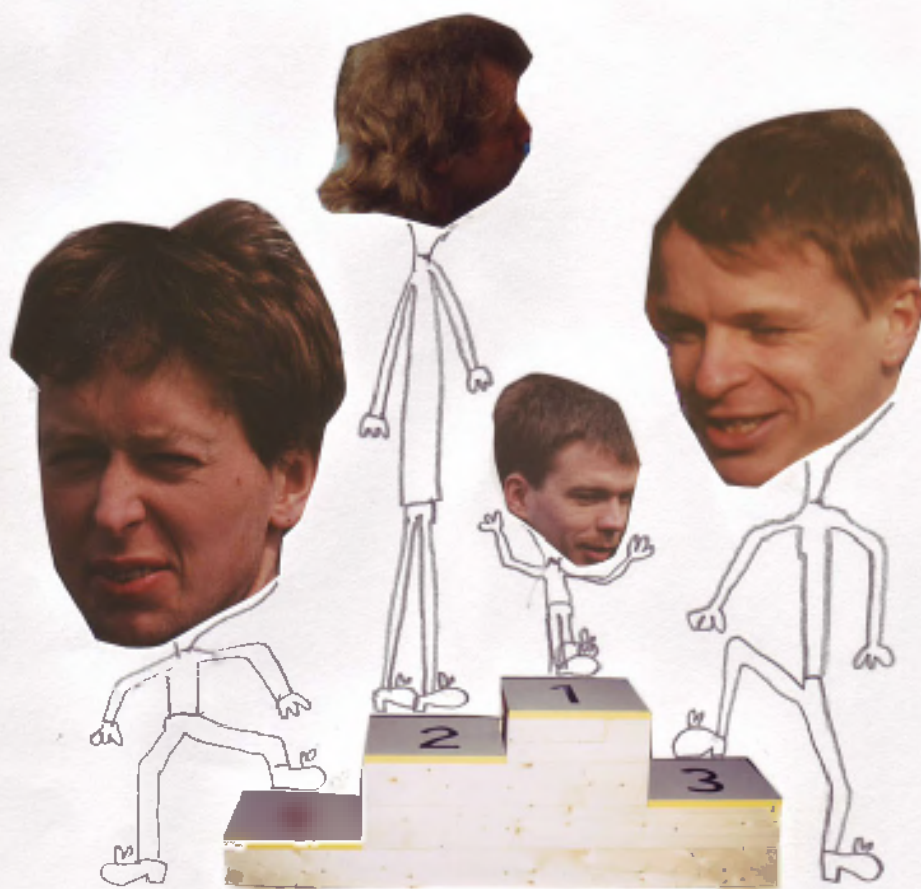
Da die Sieger schneller waren als der Fotograf, mußte dieses Bild improvisiert werden !