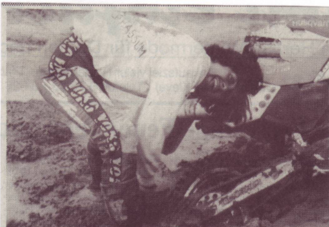
D a hilft kein Fluchen, sondern nur noch Galgenhumor. So manche Rallye wurde für den Enduroclub Hassum zur Schlammschlacht. Trotzdem waren die Rallyefahrer mit ihrer vergangenen Saison ganz zufrieden. In Nordbelgien veranstalteten die Fahrer eine anspruchsvolle und doch gemütliche Erkundungstour und beim 5-Stunden-Enduro in Borgloch (Belgien) belegten die Hassumer gute Plätze.